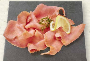
Räucherlachs geschnitten typisches Raucharoma, 100 g