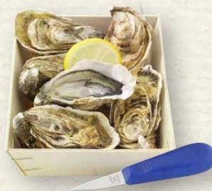
Austern „Fines de Claire“ 6 delikate Fines-de-Claire-Austern, mit passendem Austerntmesser, Box