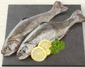
Regenbogenforellen ausgenommen, küchenfertig, aus Aquakultur