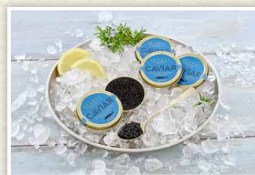
„Aqua Adamas“ Kaviar Kaviar vom adriatisch-sibirischen Stör aus Voralpen-Frischwasseraufzucht, 30 g Dose