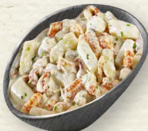
Flusskrebs-Spargelsalat Louisiana-Flusskrebschwänze im Zusammenspiel mit zartem Spargel und fruchtig-süßem Mango, in einem cremigen Dressing mit Sahne und Frischkäse