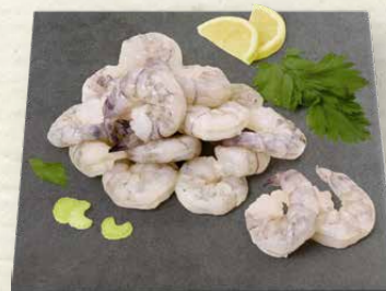
Riesengarnelenschwänze 13 / 15 Seawater Garnelen roh, ohne Kopf und ohne Schale, zum Verkauf aufgetaut, 100 g