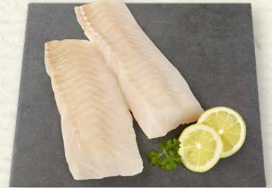
MSC Kabeljaurückenfilets ohne Haut, 100 g