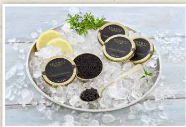
„Black Adamas“ Kaviar Kaviar vom sibirischen Stör aus Voralpen-Frischwasseraufzucht, 30 g Dose