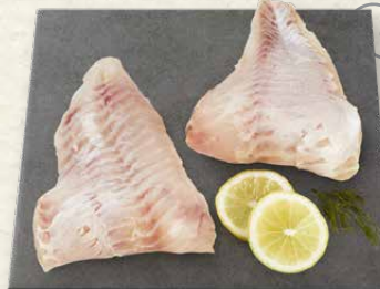
MSC Isländische Rotbarschfilets festes Fleisch, ein leichter und frischer Genuss, gefangen im Nordostatlantik, 100 g